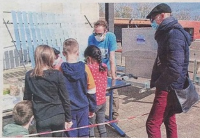
Les enfants ont préparé les cookies grâce au four solaire composé de 57 miroirs.

Le dernier atelier ludique a eu lieu dans l'école Jacques Prévert mardi 23 mars. Les enfants ont fait la connaissance d'Hélianthe la vagabonde, un four solaire installé sur une remorque. L'occasion parfaite de préparer des cookies solaires ! Mais, avant cela, il y avait l'étape obligatoire de la préparation de ces gâteaux.