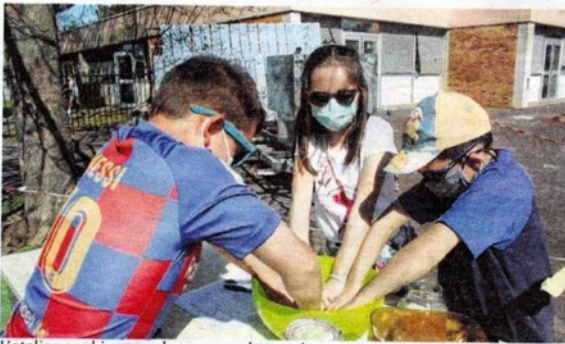
L'atelier cookies a eu beaucoup de succès.

Ils étaient fournis par les magasins Biocoop, partenaires de l'opération.