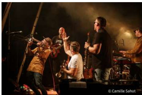
Captain Spark & Royal Company

15 concerts ont été produits en 2023 sur le festival. Avec une coloration de musiques populaires du monde entier produite par des artistes locaux (de Paris à Caen) , un public très varié a dansé et chanté vendredi soir, samedi soir, mais aussi dimanche après-midi.