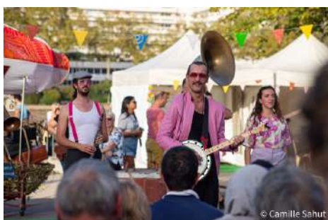
Philly's Hot Loader