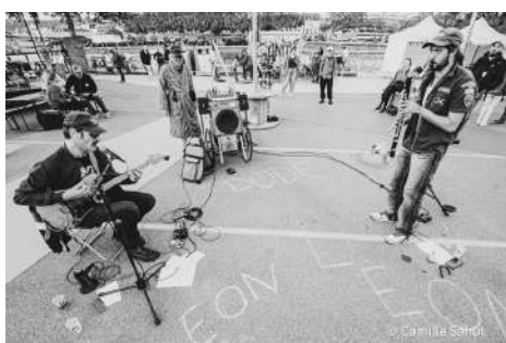
Léon & Léon