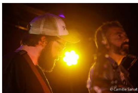
The National Wood Band