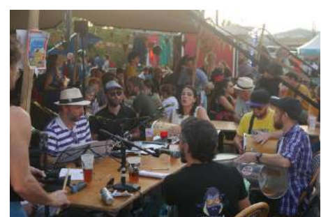
Samba de Mesa